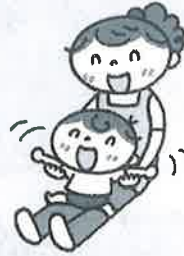
両手をはばたかせる。