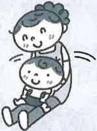
体を軽く左右に揺らしリズムをとる。