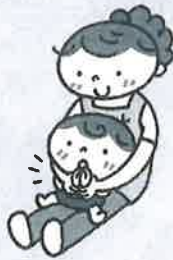
顔の前で拍手する。