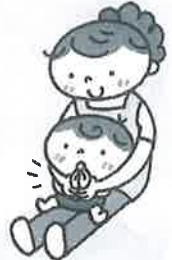
顔の前で拍手する。