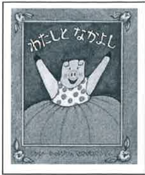
作・絵 ナンシー・カールソン 訳 なかがわ ちひろ

わたしには、素敵などもだちがいるの。 それはね……わ、た、し！ ということだろう？