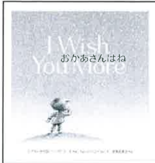
文：エイミー・クラウス・ローゼンタール 絵：トム・リビテンヘルド 訳：高橋久美子

口に出すのは、恥ずかしいかも。言葉にするのは、むずかしいかも。それならこの一冊がある！ 「あなたを想う」その気持ち、絵本を通じて、お子さんにつたえてみませんか？ (堀井拓馬 小説家)