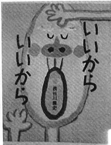
「いいから いいから」 長谷川義史 さく