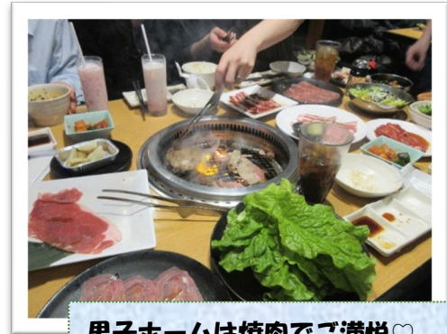
男子ホームは焼肉でご満悦♡