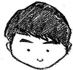
児童養護施設福音寮・栄養士